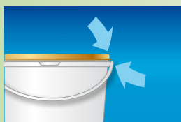
Visszazárható és porzásmentes csomagolás