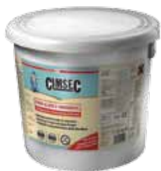
Kiszerezés: 10 kg