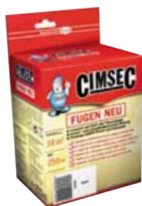
Kiszerezés: 250 ml