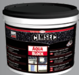
Kiszereles: 1 kg