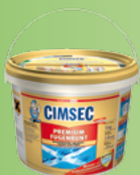
Kiszereles: 2 kg, 5 kg

Fagyálló, rendkívül rugalmas. 1–8 mm fugaszélességig. Vízlepergető, könnyen tisztítható. Köporcelán lapokhoz különösen ajánlott. Sima tapintású felületet ad. Kiemelten ajánlott padlófűtésnél, terasz burkolásánál.