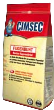
Kiszereles: 5 kg, 20 kg