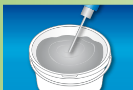
A fugázó anyag a vödörben bekeverhető